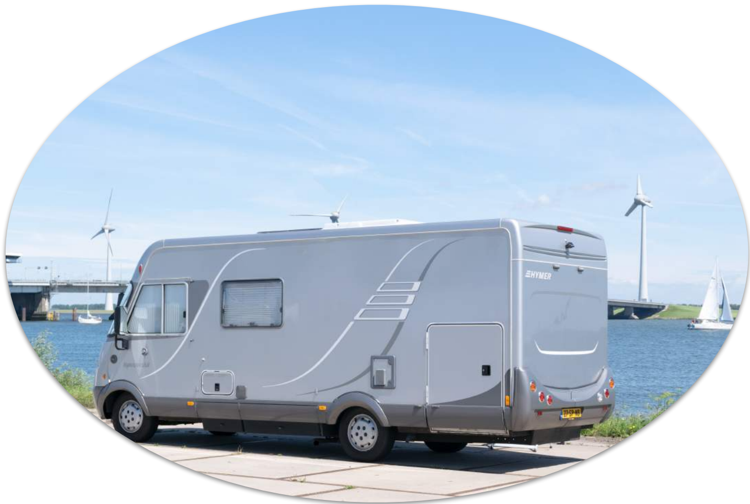
Slot Ketelbrug , Zomer Friesland