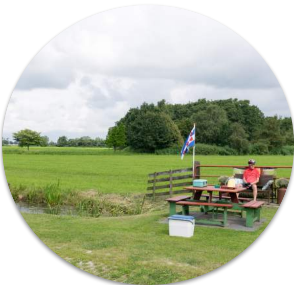
Uitrusten en theedrinken voor Afrika