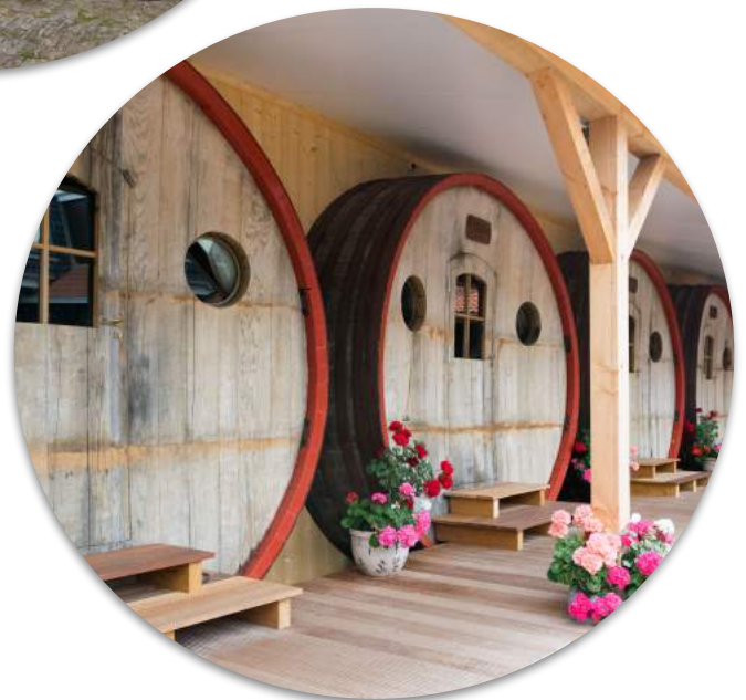
B&B, slapen in een wijnvat, dat kan bij Hotel de Vrouwe van Stavoren