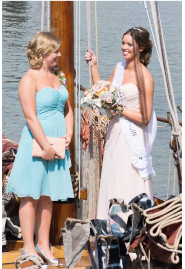
De Visserijkoningin en haar hofdame