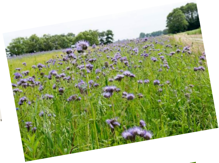
Prachtige bloemenvelden op weg naar het veer naar Ameland. Ameland echter niet bezocht.